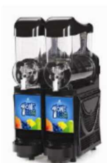
FABY SKYLINE 2- BOWL