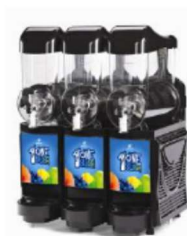
FABY SKYLINE EXPRESS 3-BOWL