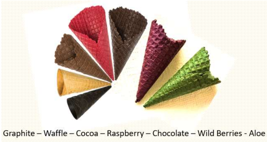
Graphite – Waffle – Cocoa – Raspberry – Chocolate – Wild Berries - Aloe

Χρώματα : Φυσικό, Κόκκινο Βατόμουρο, Πράσινο Αλόη, Μωβ Φρούτα του Δάσους, Σοκολάτα, Κακάο, Γραφίτης